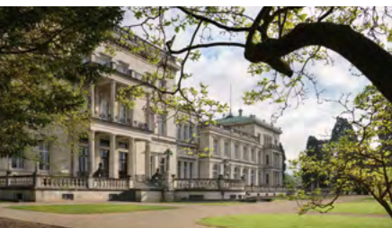
Villa Hügel, Blick auf die Südseite

Bitte wenden Sie sich für Ihre Buchung mindestens zehn Arbeitstage vor dem gewünschten Termin an den Besucherdienst der Villa Hügel. Wir empfehlen eine frühzeitige Anfrage!