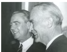
Alfried Krupp von Bohlen und Halbach (à droite) et Berthold Beitz