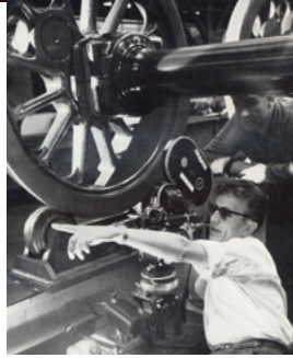
Filmaufnahmen bei Krupp, 1959