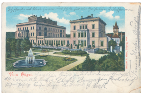
Postkarte Villa Hügel, 1904