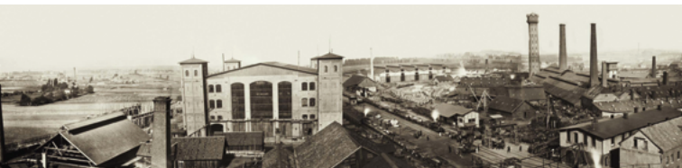
Werkspano- rama, 1864

Das Krupp-Archiv übernimmt kontinuierlich Quellen, erschließt sie systematisch und sorgt für ihren dauerhaften Erhalt. Als Langzeitgedächtnis leistet es internen Service für die Alfred Krupp von Bohlen und Halbach-Stiftung und die thyssenkrupp-Unternehmensgruppe. Mit Publikationen, eigenen Präsentationen und der Betreuung der »Historischen Ausstellung Krupp« fördert es die geschichtliche Bildung.