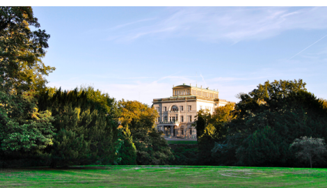
Villa Hügel, Blick auf die Nordseite

Bitte wenden Sie sich mindestens zehn Arbeitstage vor dem gewünschten Termin an den Besucherdienst der Villa Hügel und besprechen Sie die Details Ihrer geplanten Führung. Zu den Hauptreisezeiten empfiehlt sich eine sehr frühzeitige Anfrage!